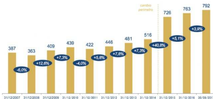
Evoluzione delle masse gestite dal Private Banking valori in miliardi di euro